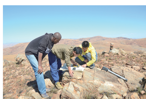
核地质所 马达加斯加项目野外工作