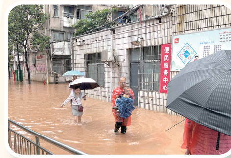
遥感所 2022年6月，衡阳基地中心工作人员进行住宅小区抢险救灾