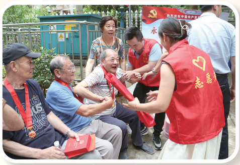
核地质所 2021年核地质所青年开展以“光荣在党50年，接续奋斗薪火传”为主题的“我为群众办实事”志愿者服务