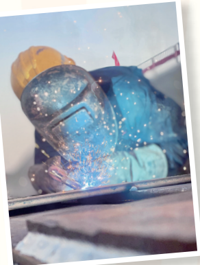
基础公司 焊花飞舞