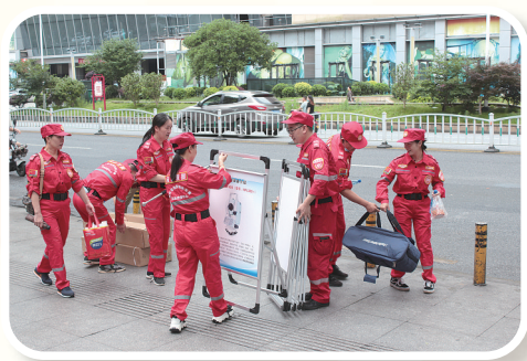
矿调所 2022年6月12日，应急救援中心参加郴州北湖区2022年“安全生产月”集中宣传